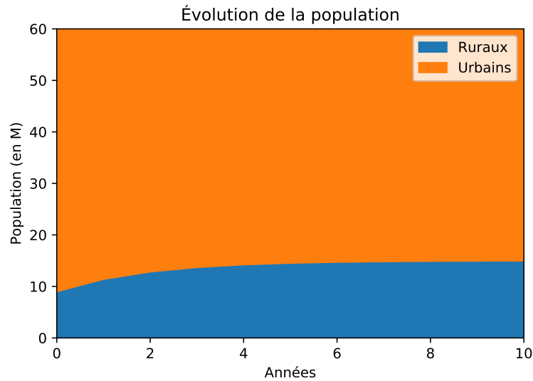
FIGURE 1 – Visualisation alternative